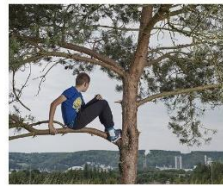
MARGUERITE Paul, Sève + 466000 + 01_2017_10x145 cm

Une œuvre visuelle, ça se regarde, ça se parle aussi, donc ça s'écoute, aussi.